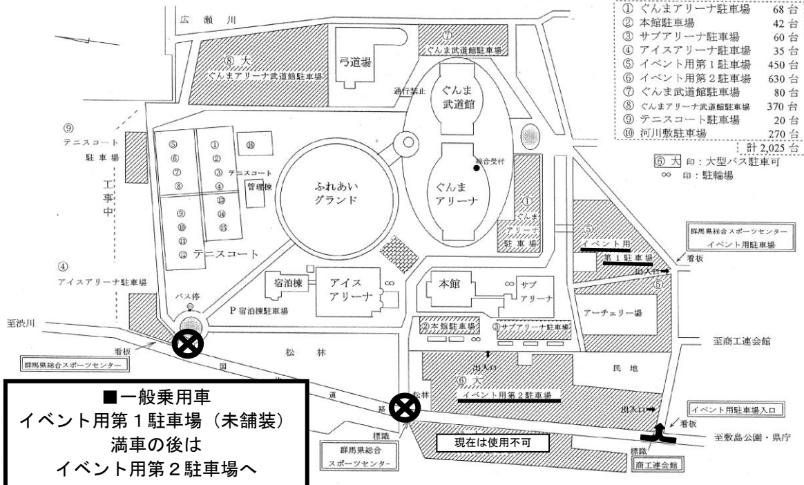
群馬県総合スポーツセンター全体図